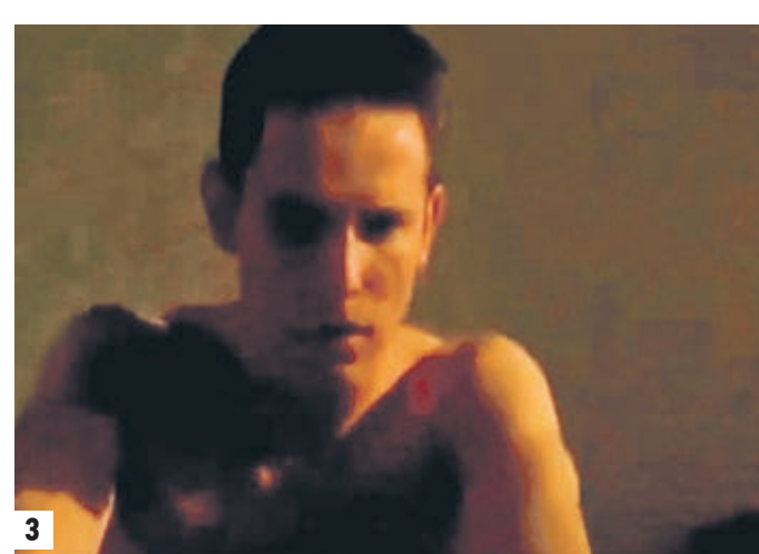
1 Герой Джонатана Керригана ждет автобус на общественной остановке 2 В реальности «наоборот» успешный менеджер не сумел на танцполе найти партнершу 3 Пережив многое, герой понял, что такое настоящий кошмар