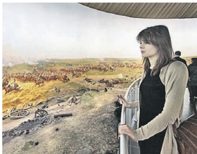
Музей-панорама «Бородинская битва» открыт для всех, в том числе для людей с ограниченными возможностями