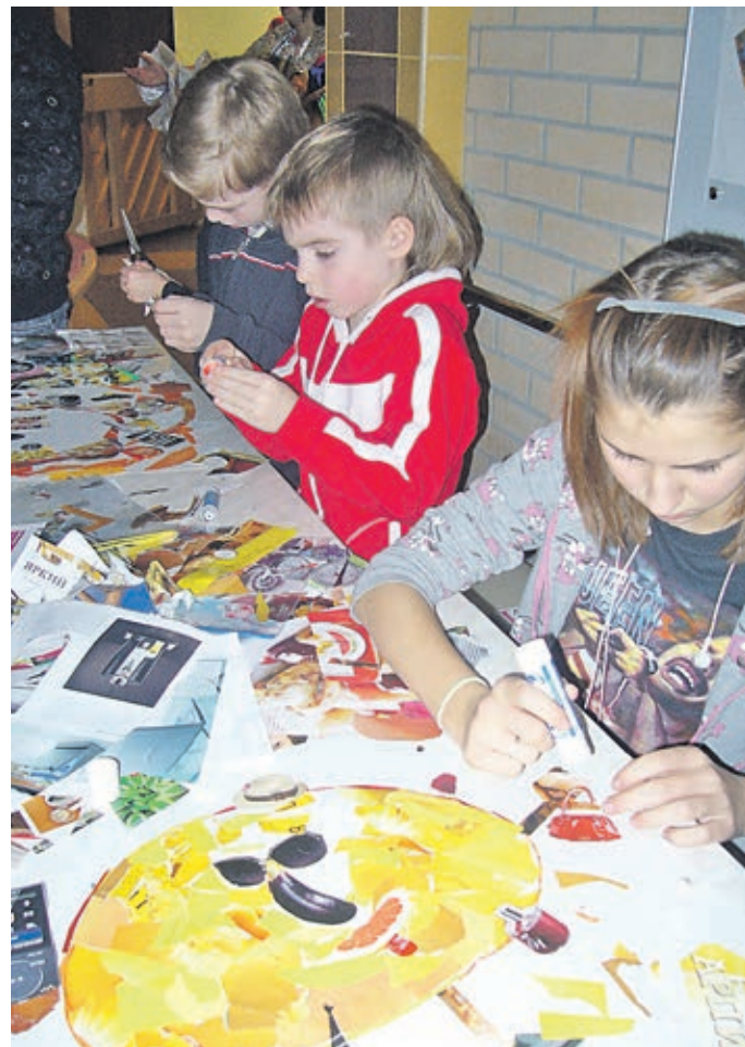
Глухие дети в студии «Арт-чудеса» создают картины уникальной техники — из бумаги

Опыт работы детей с бумагой постепенно накапливался и систематизировался, появи-